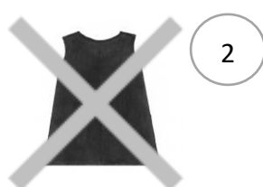
Plastic schort uittrekken en in de afvallemmer gooien