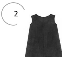
Draag een plastic schort