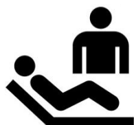
Bij lichamelijke verzorging van de cliënt