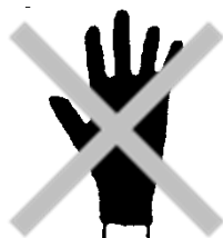
Handschoenen uittrekken en in de afvallemmer gooien